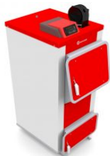
Q Plus 15 кВт

Универсальные твердотопливные котлы с очень вместительной топкой, благодаря чему достигается очень длительное время работы котла как на дровах, так и на угле (до 3-х суток* при использовании контроллера и наддувного вентилятора). Предназначены для сжигания рядового угля, штыба, различной древесины и брикетов. Котлы оснащены чугунными колосниками. Регулировка поддува в модели Q Alfa производится вручную, с помощью регулятора тяги (опция) или комплекта автоматики, оснащенного контроллером и вентилятором. В котле Q Plus - только с помощью автоматики. Корпус котла выполнен из котельной стали толщиной 5 мм. Гарантия: 10 лет на целостность сварных швов, 6 лет на герметичность теплообменника, 2 года на котел. Срок службы котла - до 20 лет.