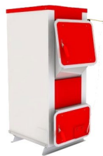
Q Alfa 15 кВт